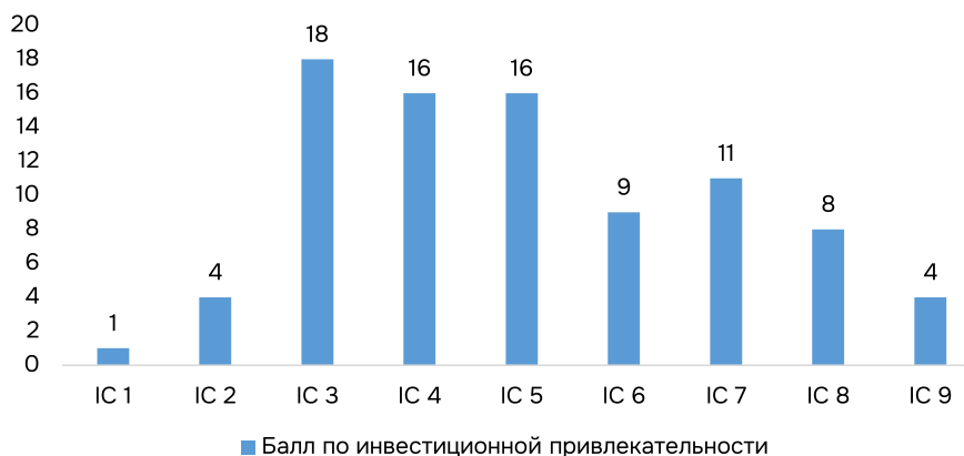
Рис. 2. Распределение регионов по группам инвестиционной привлекательности в 2023 году [10].

способность в перспективе среднего срока, должны учитывать основные тенденции повестки устойчивого развития. Эти тенденции связаны с технологическим прогрессом и цифровизацией, развитием с учетом низкого уровня углерода и фор-